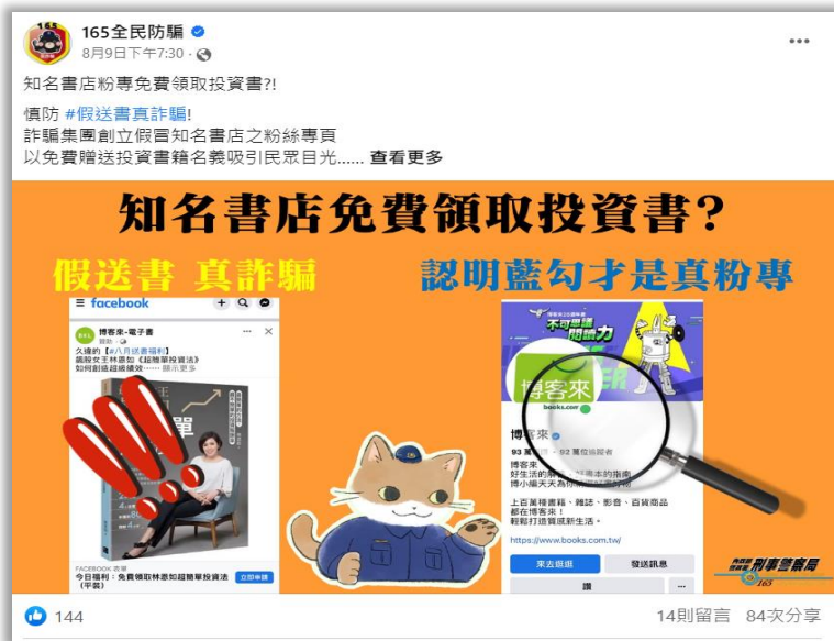
線上-宣導資訊示意圖