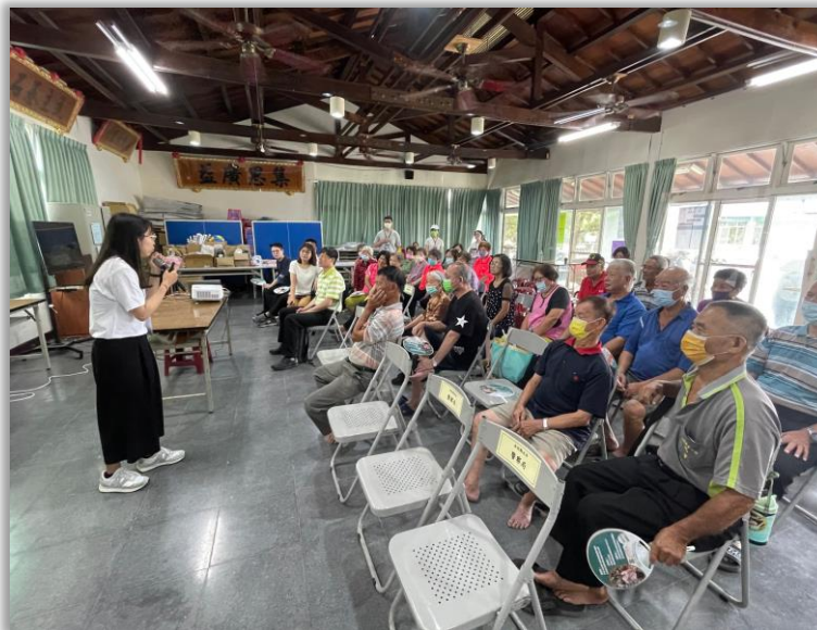
線下-實體手把手互動意圖